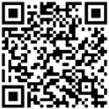
QR-Code Offener Kindertreff