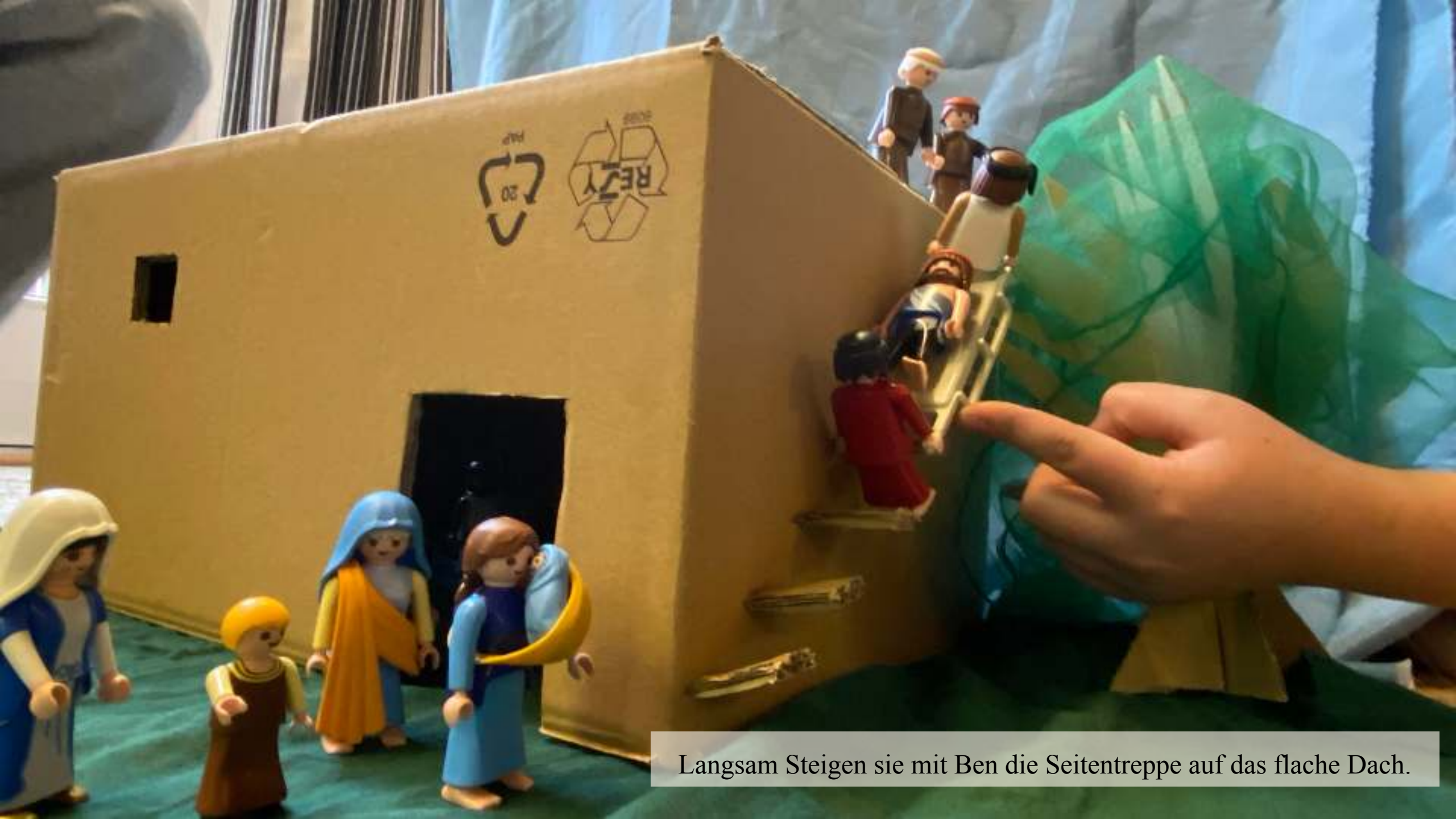
Langsam Steigen sie mit Ben die Seitentreppe auf das flache Dach.