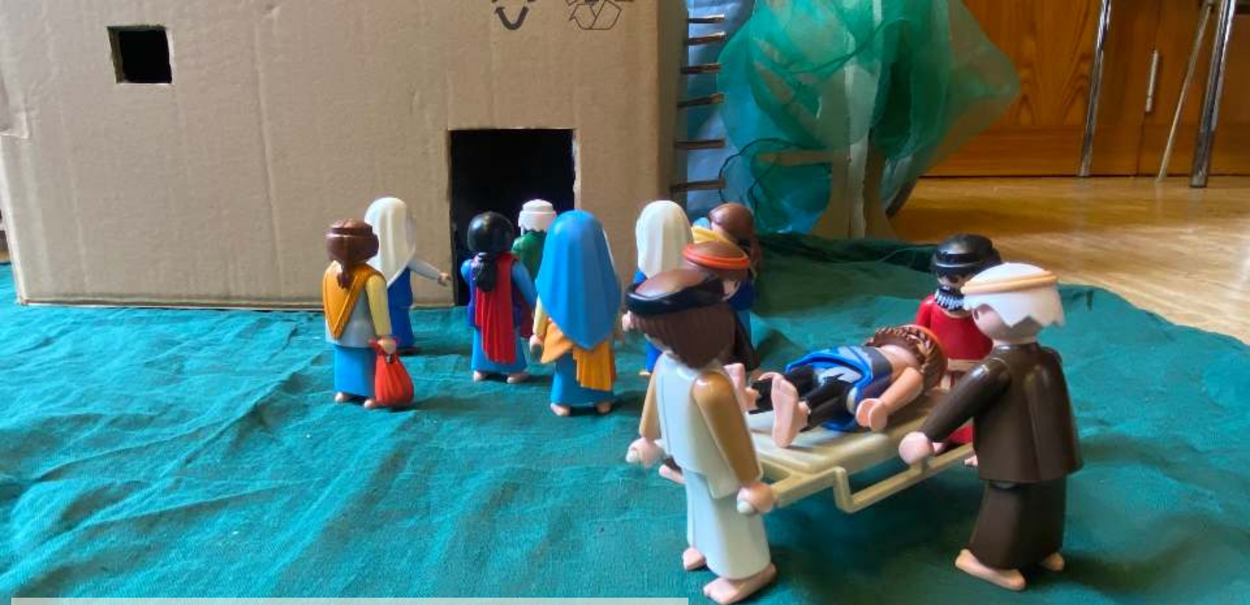
Am Haus angekommen sehen sie eine riesen Menschen menge die in das Haus drängen, da kommen sie nicht herein denken sie.